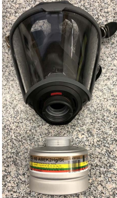
Maske mit Filter

Vor Benutzung jeweils die Kappen oben und unten am Filter abnehmen. Nach gebraucht ist der Filter zu entsorgen und die Maske zu reinigen.